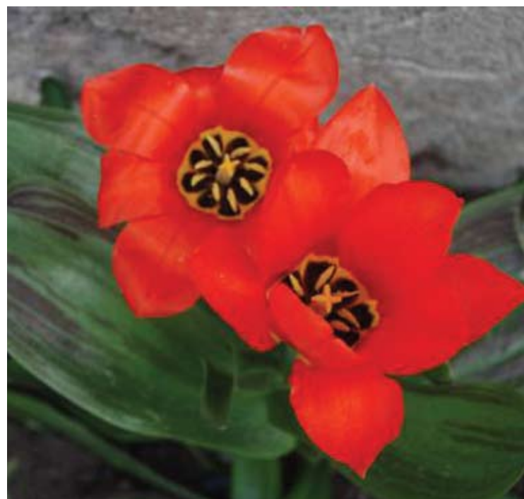
„Anykštos“ jaunujų žurnalistų būrelis.